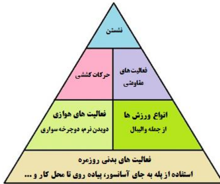
شکل ۱. هرم فعالیت بدنی

گیرند. در سطح سوم هرم، حرکات کششی و فعالیت های مقاومتی قرار دارند. در قله هرم، فعالیت هایی قرار دارند که اگرچه فعالیت بدنی محسوب می شوند اما جزء فعالیت های کم تحرک محسوب می شوند به همین دلیل باید آنها را به کمترین میزان ممکن رسانند. از جمله این فعالیت ها می توان تماشای تلویزیون، استفاده از موبایل و یا بازی های کامپیوتری را نام برد. این فعالیت ها علاوه بر افزایش خطر ابتلا به بیماری های مختلف جسمانی و روانی، موجب کاهش انعطاف پذیری مفاصل و قدرت و استقامت عضلانی و در نتیجه خطر آسیب دیدگی و دردهای اسکلتی عضلانی می شوند.